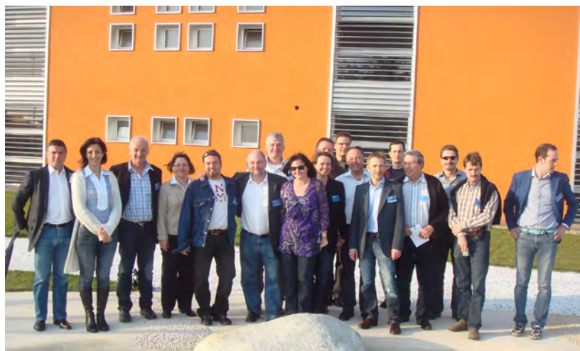
Gute Laune hatten die Topras-Fachhändler mitgebracht, die an der zweitägigen Schulung teilnahmen. Nach der theoretischen Einweisung konnten die Fachhändler selbst den Bau dieser Badeanlagen einüben.