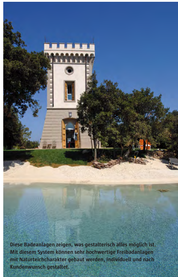
Diese Badeanlagen zeigen, was gestalterisch alles möglich ist. Mit diesem System können sehr hochwertige Freibadanlagen mit Naturteichcharakter gebaut werden, individuell und nach Kundenwunsch gestaltet.