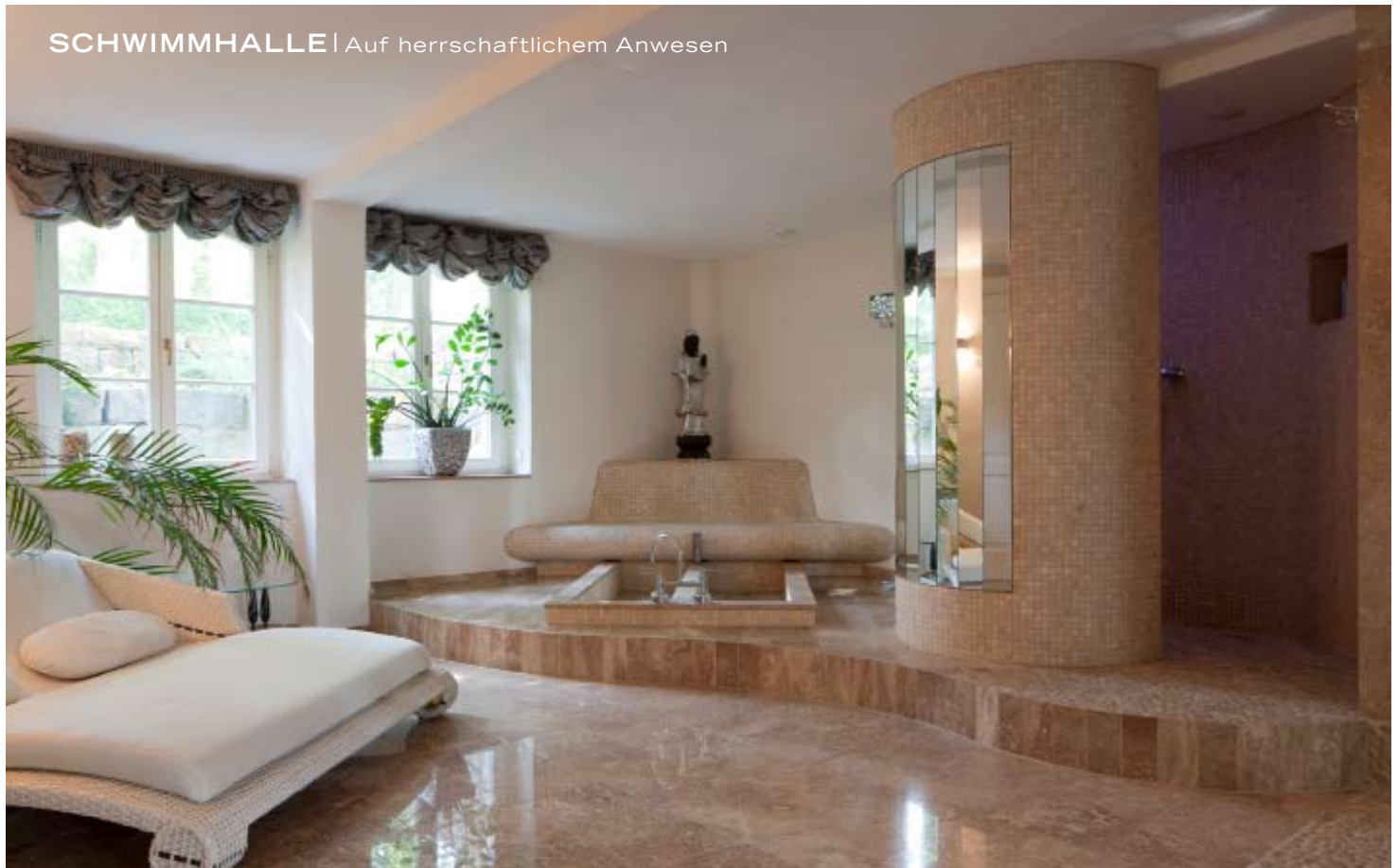
Den Wellness-Bereich dominieren glänzend polierter Naturstein und kleinformatische Mosaikfliesen.