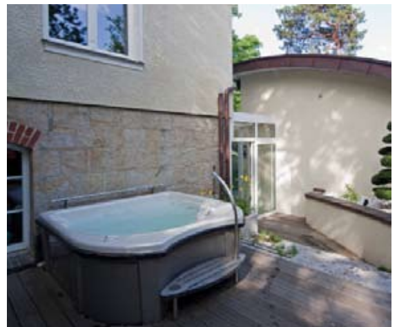
Harmonisch und unter Erhalt der Sichtbeziehung zur Villa integriert sich die neue Schwimmhalle in den Garten. Der Whirlpool ist über einen Windfang erreichbar.

Ein geschichtsträchtiger Ort am Wannensee, das Grundstück mit direktem Zugang zum Wasser, ein herrlicher unter Denkmalschutz stehender und bereits 1908 angelegter Garten mit einer Villa aus der Gründerzeit. Hier leben drei Generationen unter einem Dach.