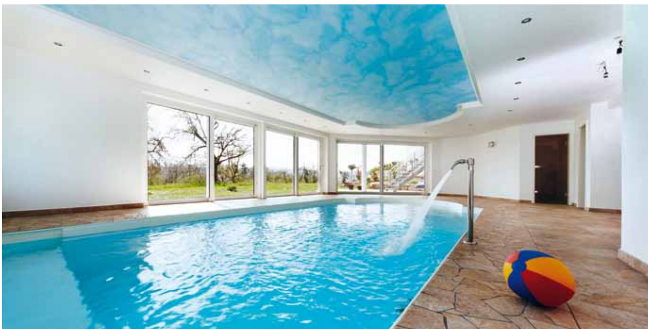
Genau so, wie es der Bauherr wollte: ein attraktives, aber nicht allzu großes Schwimmbecken, das aber mit vielen Annehmlichkeiten ausgestattet ist. Dank einer kraftvollen Gegenstromanlage ist ein ausgiebiges Schwimmtraining möglich. Für eine angenehme Nackenmassage sorgt die Schwallldusche am Beckenrand. Und rings ums Becken wurde genügend Raum geschaffen, um hier angenehm relaxen und den Ausblick in den Garten genießen zu können.