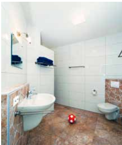
Auf gleicher Ebene, aber in einem separaten abgetrennten Bereich, wurden Dusche, WC und Umkleidemöglichkeit geschaffen.