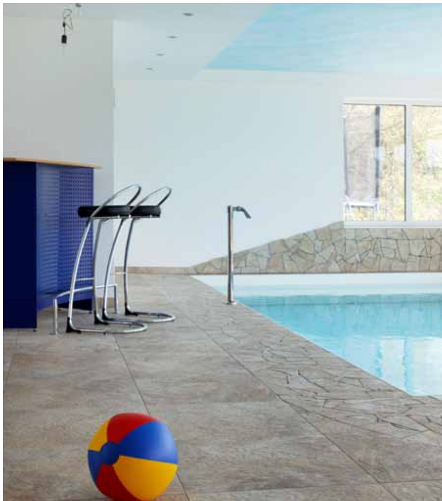
Ein oktagonaler verlegter Natursteinboden im Umgangsbereich und der bemalte Himmel an der Decke unterstreichen den individuellen Charakter der Anlage

Schwimmbadtechnik: Topras GmbH, 85591 Vaterstetten Tel.: 08106/995832-0 info@topras.de, www.topras.de