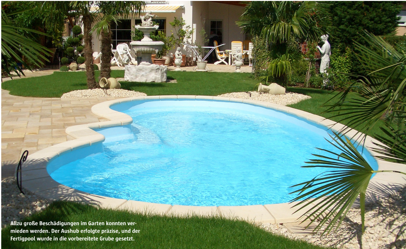
Allzu große Beschädigungen im Garten konnten vermieden werden. Der Aushub erfolgte präzise, und der Fertigpool wurde in die vorbereitete Grube gesetzt.