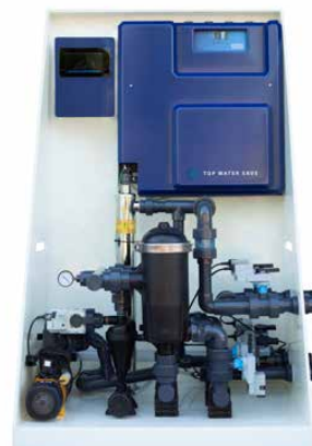
Top Water Save PROFESSIONALE PLUS Automatico