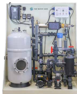
Top Water Save PREMIUM