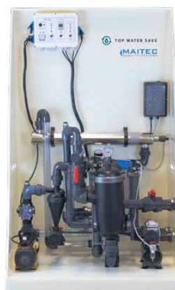
Top Water Save PROFESSIONALE