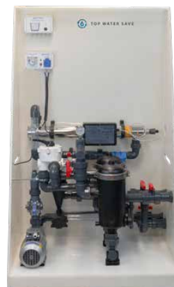
Top Water Save BASE

Il sistema di moduli filtranti, appositamente sviluppato, tratta in modo completo l'acqua piovana e l'acqua di risciacquo delle piscine, fornendo acqua di ottima qualità . Un contributo importante per garantire approvvigionamenti idrici sostenibili sia nell'impiantistica privata che pubblica.