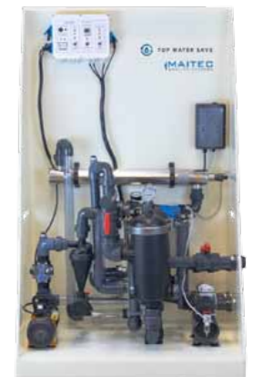
Top Water Save PROFESSIONAL