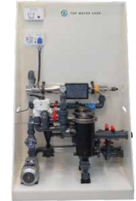
Top Water Save BASIC

Zubehör, Tanks und Behälter auf Anfrage verfügbar.