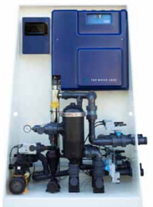
Top Water Save PROFESSIONAL +