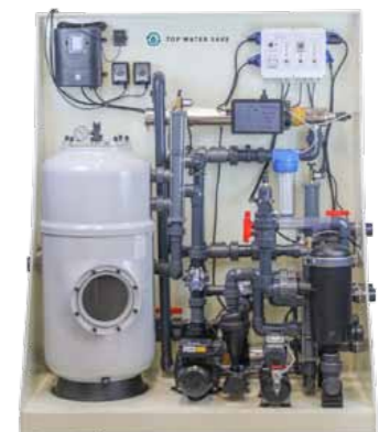
Top Water Save PREMIUM